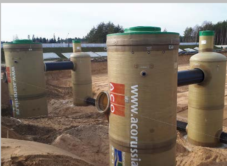
Индустриальный парк "Великий камень" "Оборудование для очистки поверхностного стока в составе ЛОС накопительного типа с самым большим в мире безбетонным аккумулирующим резервуаром АСО StormBrixx, Минск, Республика Беларусь